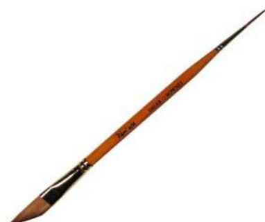
Duo Double Script

N'OUBLIEZ PAS... vos caméras et appareils photos pour conserver et échanger tous VOS magnifiques souvenirs.