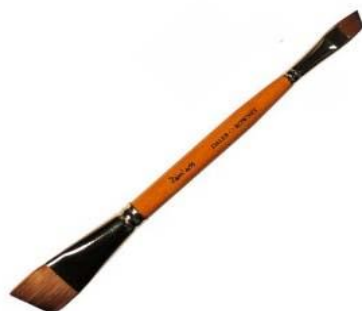
Duo Double biseauté