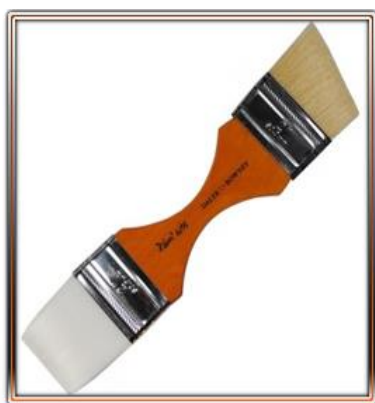
Duo Double Spalter

L'autre côté en poils durs pour les audacieuses matières et textures.